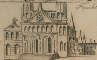
A. de Chelles